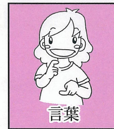
曲げた両手人差指を上下に置き、「」を示す